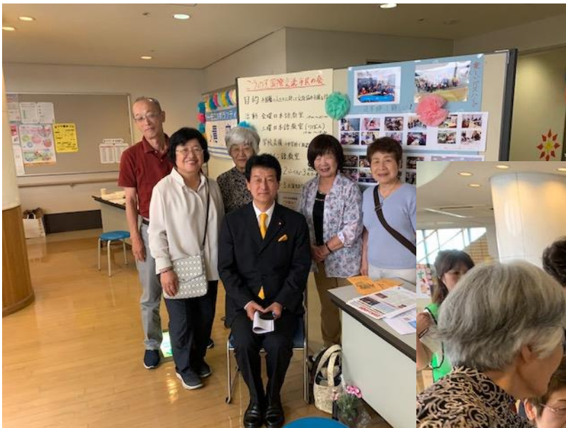
私達のブースを訪れてくれた 国会議員、県会議員、市会議員へ